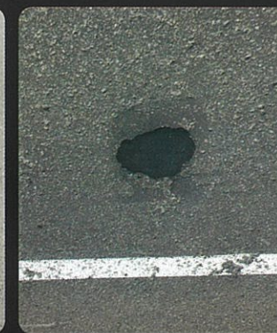
車道ポットホール補修