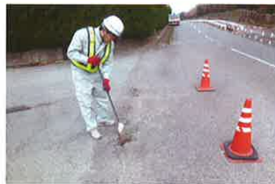
2 補修前にゴミや砂などを取り除きます。