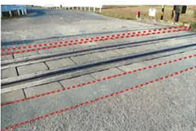
踏切の段差修正に 施工後5年