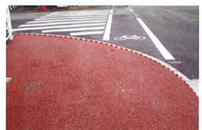
カラータイプもあります