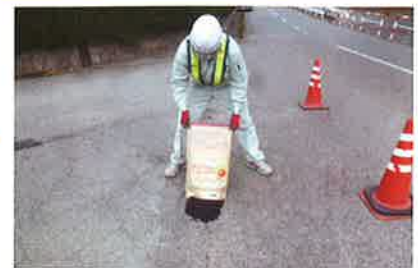
3 補修箇所にオレンジパッチを充填して下さい。