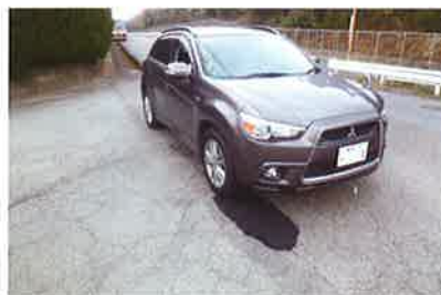
5 補修後直ちに車両の通過が可能です。通過車両の転圧で強度が増強します。