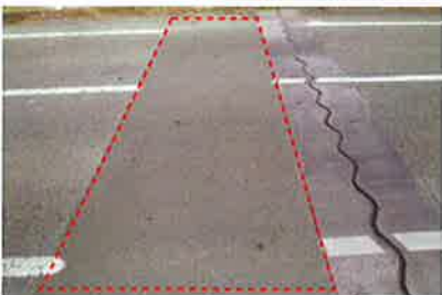
橋梁ジョイント部の段差修正に 施工後3年