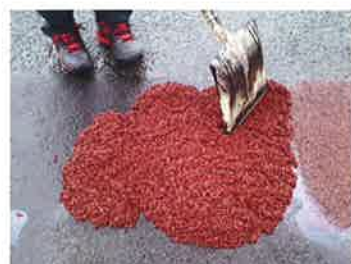
カラータイプもあります