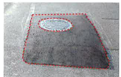
マンホールの段差修正に