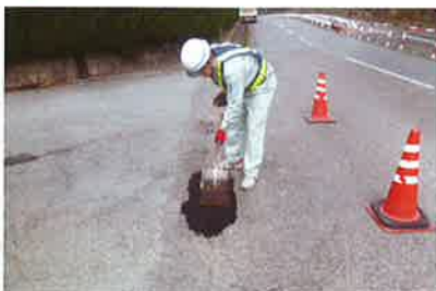
4 充填したオレンジパッチをスコップで均し、多少余盛して平らにして下さい。