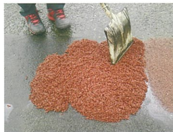
カラータイプもあります