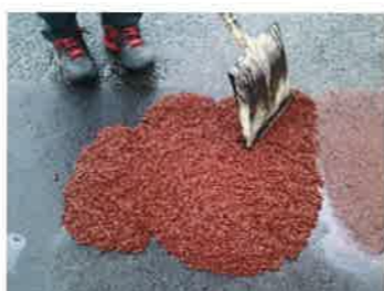
カラータイプもあります